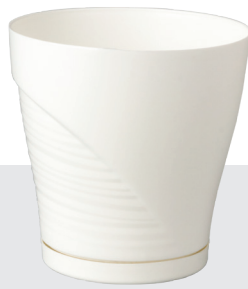
ø 10,5 / 15,5 x 13,5 cm